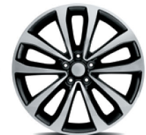
Versión GT automático.