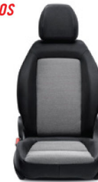
SE MT SPORT AUTOMÁTICO